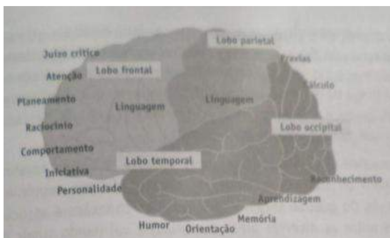
Figura 3. Localização das funções cognitivas no córtex cerebral (Nunes, 2014)