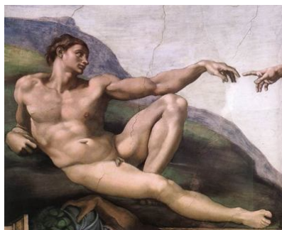
Criação do Homem Miguel Angelo

9. Nisto a música sacra não obedece a leis e normas diversas das que regulam todas as formas de arte religiosa, antes à própria arte em geral. Na verdade, não ignoramos que nestes últimos anos alguns artistas, com grave ofensa da piedade cristã, ousaram introduzir nas igrejas obras destituídas de qualquer inspiração religiosa, e em pleno contraste até mesmo com as justas regras da arte. Procuram eles justificar esse deplorável modo de agir com argumentos especiosos, que eles pretendem fazer derivar da natureza e da própria índole da arte. Afinal, dizem eles que a inspiração artística é livre, que não é lícito subordiná-la a leis e normas estranhas à arte, sejam elas morais ou religiosas, porque desse modo se viria a lesar gravemente a dignidade da arte e a criar, com vínculos e ligames, óbices ao livre curso da acção do artista sob a sagrada influência do estro.