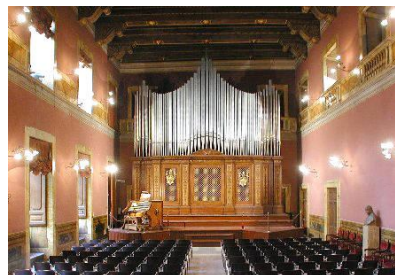
Órgão do PIMS

28. Devem essas normas aplicar-se, outrossim, ao uso do órgão e dos outros instrumentos musicais. Entre os instrumentos a que é aberta a porta do templo vem, de bom direito, em primeiro lugar o órgão, por ser particularmente adequado aos cânticos sacros e aos sagrados ritos, por conferir às cerimônias da Igreja notável esplendor e singular magnificência, por comover a alma dos fiéis com a gravidade e doçura do seu som, por encher a mente de gozo quase celeste, e por elevar fortemente à Deus e às coisas celestes.