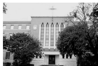
Seminário dos Olivais