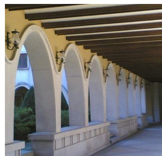
Claustros de Singeverga