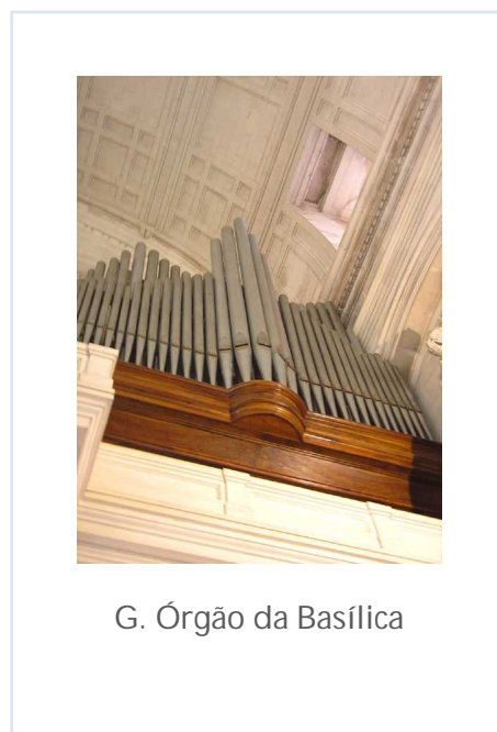
G. Órgão da Basílica