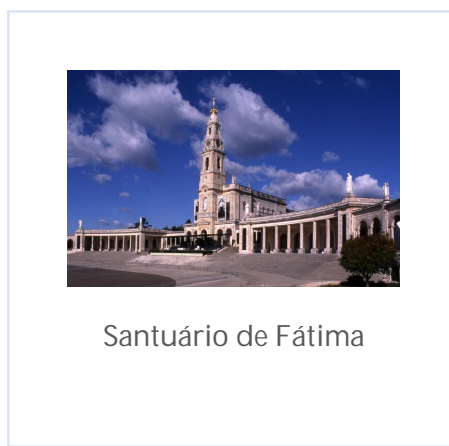
Santuário de Fátima

A centralidade do Santuário viria a ter consequências nas manifestações musicais do âmbito eclesial, contribuindo para certo estilo de canto litúrgico em Portugal. As visitas da Imagem Peregrina, a partir de 1940, a realização de congressos católicos em Fátima nos anos 50, a organização do culto para responder à crescente vinda de peregrinos portugueses e estrangeiros originaram um repertório musical próprio, com o contributo de numerosos compositores.