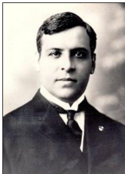
Aristides de Sousa Mendes