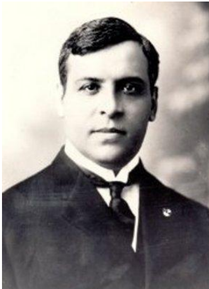
Aristides de Sousa Mendes

Falo, é claro, do drama dos refugiados, muitos dos quais só puderam atingir os Estados Unidos a partir de Lisboa, e que por aqui iam sobrevivendo, quais fantasmas à espera do barco ou do vôo libertador.