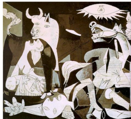
Guernica, de Pablo Picasso

Morre pois o mestre-capela, nasce o compositor livre, que, de Mozart culminará em Beethoven, o grande símbolo dessa libertação, conseguida também graças aos princípios da Revolução Francesa. E, não por acaso, com a sua própria libertação, Beethoven consegue a dos outros. A 3ª, 5ª e 9ª Sinfonias, simbolizam ainda hoje, para muitos de nós essa aspiração à liberdade do indivíduo face a uma sociedade que, muitas vezes, o esmaga. E não é por acaso que o sinal musical para o avanço aliado no tragédia que foi a Segunda Guerra Mundial, juntamente com os dois dedos em "V" da vitória, foi o célebre início da 5ª Sinfonia de Beethoven, ou que o hino da União Europeia, utopia - ou talvez não - de um mundo mais solidário e tolerante, seja precisamente o final da 9ª.