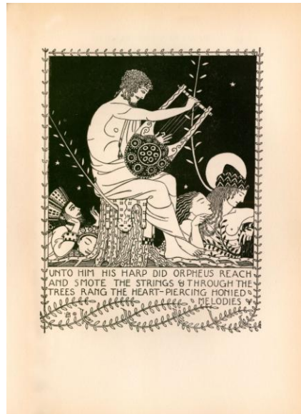
Orfeu tocando lira

"Está um chapéu azul sobre o penteador ao meio da mesa da esquerda".