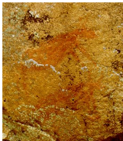
Gravuras do Côa

Os primeiros objectos sonoros que podemos distinguir nesse magma natural são objectos que simultaneamente se ordenam num acto dominado pela cultura e reconhecidos como instrumentos musicais. Tentativas longínquas de acomodar o ouvido à magia criativa.