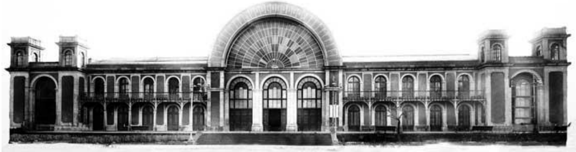
Palácio de Cristal

Ao longo destes 100 anos, os locais habituais de realização de manifestações musicais de diversa natureza - concertos de orquestra, música de câmara ou solística, ópera e bailado -, foram escasseando progressivamente. O desaparecimento do Palácio de Cristal constituiu um rude golpe para a Cultura. Cinemas como Águia de Ouro, Júlio Dinis, Sá da Bandeira, Batalha ou Trindade viriam a fechar as suas portas ou a desviar para fins menos nobres os cartazes que ainda afixam. Nos nossos dias, honra seja feita a salas como as do S. João, do Rivoli ou do Coliseu, cuja intensa e diversificada programação garante à cidade a vida cultural de que é merecedora. Outro tanto há a esperar do Auditório Carlos Alberto, após a remodelação em curso. Finalmente, não pode ser esquecida a importantíssima participação das Fundações Engenheiro António de Almeida e Cupertino de Miranda, bem como de algumas igrejas na divulgação de um riquíssimo património que é, acima de tudo, nacional.