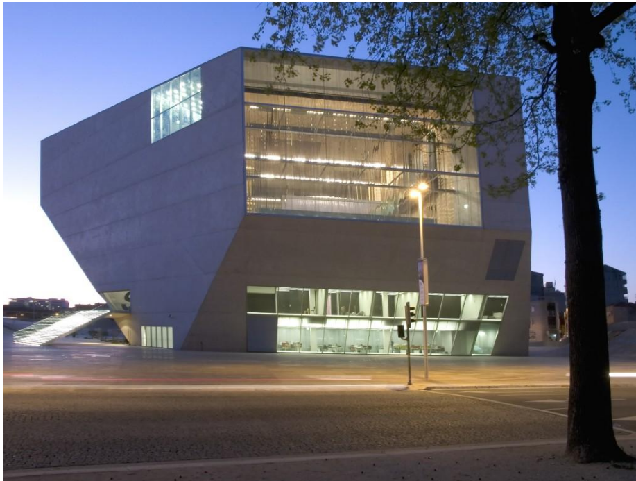
Casa da Música